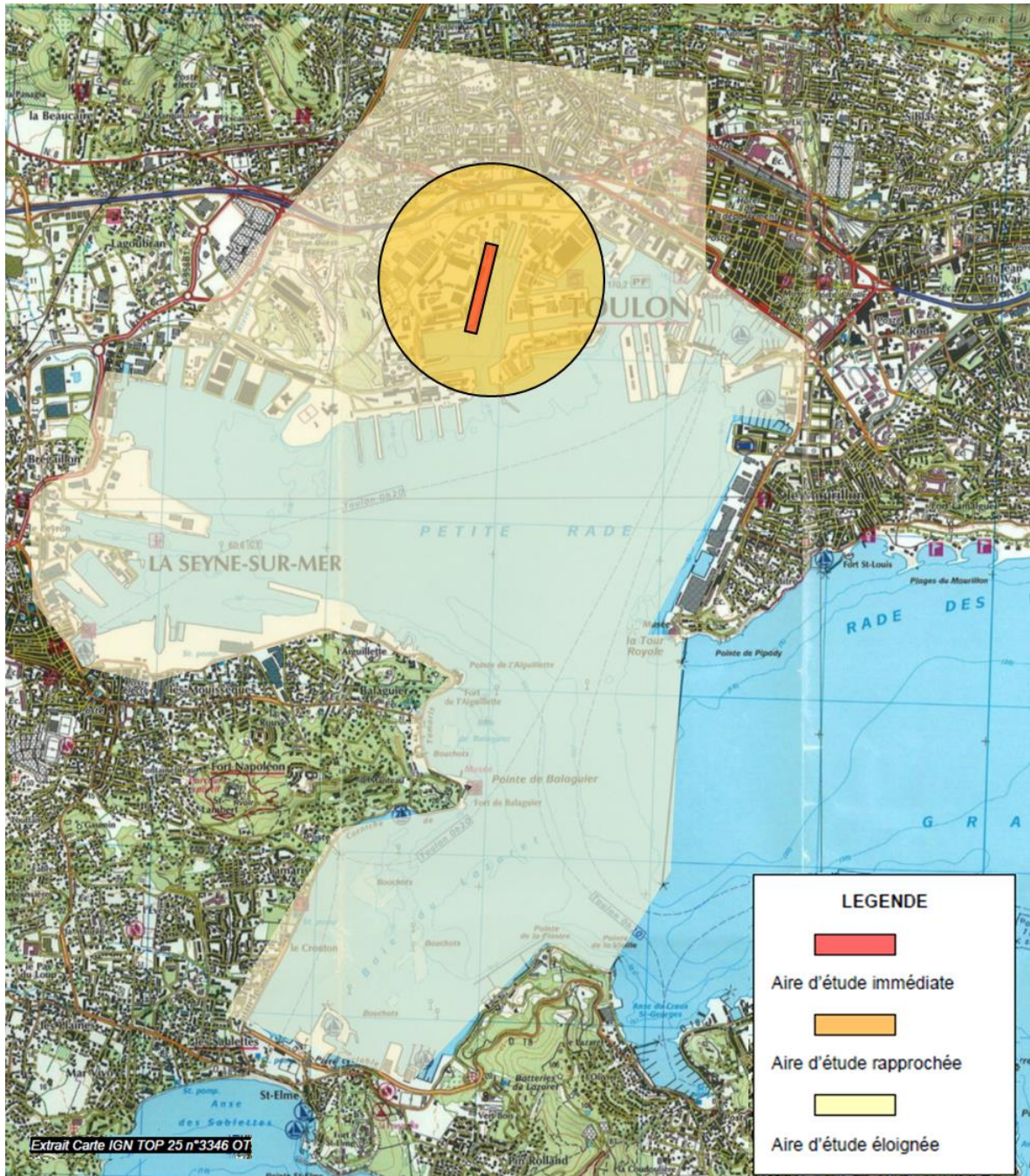
Figure 1. Aires d'étude du projet